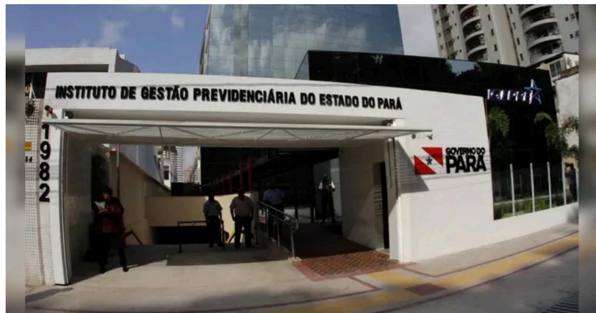
Instituto de Gestão Previdenciária e Proteção Social do Estado do Pará (IGEPPS)

Em meio à crescente demanda por serviços públicos mais ágeis e eficientes, o Governo do Pará abriu uma nova oportunidade para profissionais que desejam ingressar no setor público estadual. Com salário chegando a R$ 6.567,47, o Instituto de Gestão Previdenciária e Proteção Social do Estado do Pará (IGEPPS) lançou um Processo Seletivo Simplificado (PSS) para contratação temporária de especialistas de nível superior.