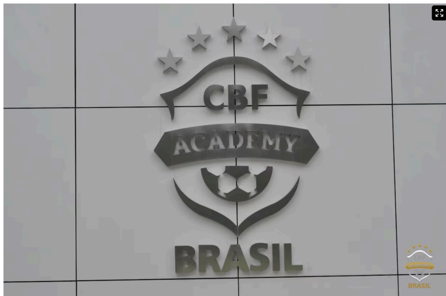
CBF Academy tem parceria comercial com instituição de ensino fundada pelo ministro do STF Gilmar Mendes.

Ainda se fala no fato de o relator do processo que manteve Ednaldo no cargo ter sido o ministro Gilmar Mendes, que recebeu o processo por sorteio. É discutido possível conflito de interesses, já que o magistrado é fundador do Instituto Brasileiro de Ensino, Desenvolvimento e Pesquisa (IDP), o qual tem parceria comercial para as formações da CBF Academy.