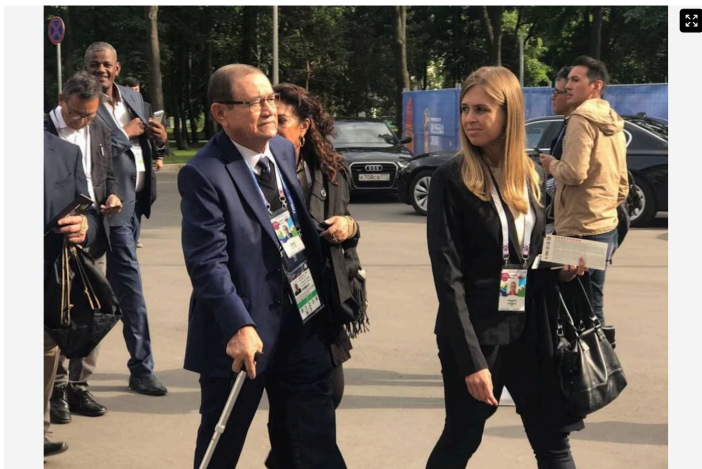
Nunes era presidente da CBF durante a Copa do Mundo da Rússia, em 2018, quando já apresentava sinais de saúde debilitada.

Nunes foi presidente da Federação Paraense de Futebol por quase 20 anos. Ele era o cartola que comandava a CBF durante a Copa do Mundo de 2018, na Rússia. Foi o primeiro comando de um militar da entidade em um Mundial desde o fim da ditadura.