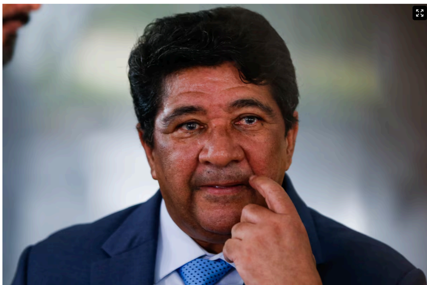
Ednaldo Rodrigues foi reeleito presidente da CBF, mas vê instabilidade crescer.

A perícia questiona o fato de o nome ter sido assinado em 19 de janeiro, cinco dias antes da assinatura de fato do acordo, “já conferindo ao procurador poderes específicos para pleitear a homologação judicial de um acordo ainda inexistente à época”.