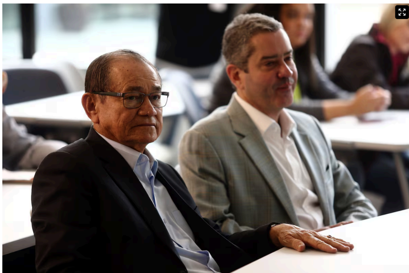
Coronel Nunes (à esquerda) presidiu a CBF interinamente duas vezes, uma antes e uma depois de Rogério Caboclo (à direita).

Outra informação apontada é que, em junho de 2023, Nunes informou à Justiça um déficit cognitivo a partir de neoplasia cerebral maligna (tumor no cérebro) e cardiopatia grave. Ambas são condições clínicas severas que exigem tratamento contínuo de Nunes desde 2018.