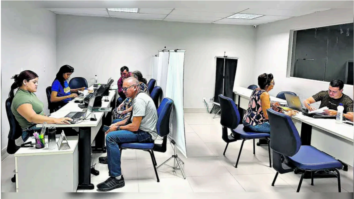
📷 O Censo Previdenciário é previsto na Lei Federal nº 10.887/2004, como forma de evitar pagamentos indevidos e fraudes.

Faltando apenas três dias para o fim do prazo de realização do Censo Previdenciário, mais de 10 mil segurados ainda não compareceram às agências do Instituto de Gestão Previdenciária e Proteção Social do Estado (IGEPPS) para atualização de dados obrigatória.