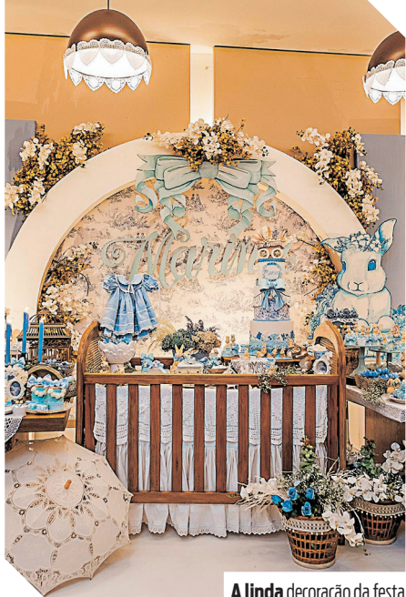
A linda decoração da festa