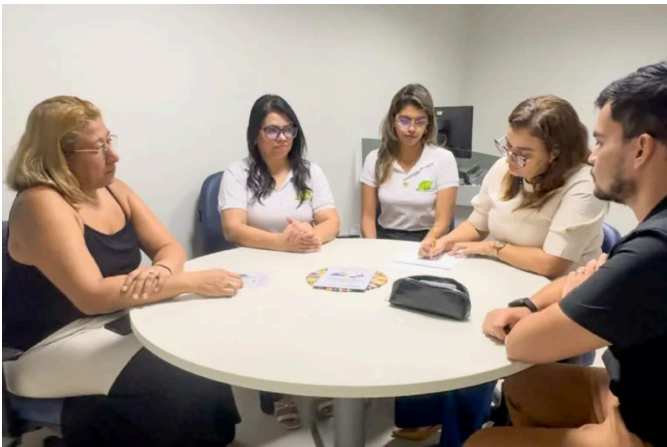
Instituto de Gestão Previdenciária e Proteção Social do Estado (IGEPSS) se empenha para orientar usuários sobre controle e prevenção de débitos.

Diante das dúvidas sobre superendividamento apresentadas por servidores e segurados em encontros do programa “Papo Previdenciário”, ação realizada pela Diretoria de Previdência (DIPRE) e o Núcleo de Atendimento Psicosocial (NAPS), o Instituto de Gestão Previdenciária e Proteção Social do Estado (IGEPSS) identificou a necessidade de realizar uma ação específica para tratar sobre educação financeira.