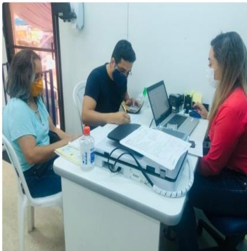
Por: Foto: Daniela Pantoja

O Instituto de Gestão Previdenciária do Estado do Pará (IGEPREV) instalou nesta segunda-feira (10), em Santarém (PA), uma unidade móvel para promover atendimentos a quem busca verificar situação de aposentadorias, pensões e contribuições previdenciárias, entre outros.