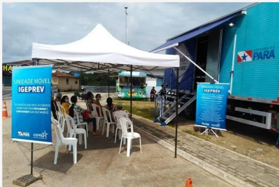
Igeprev Itinerante inicia atendimento em Paragominas